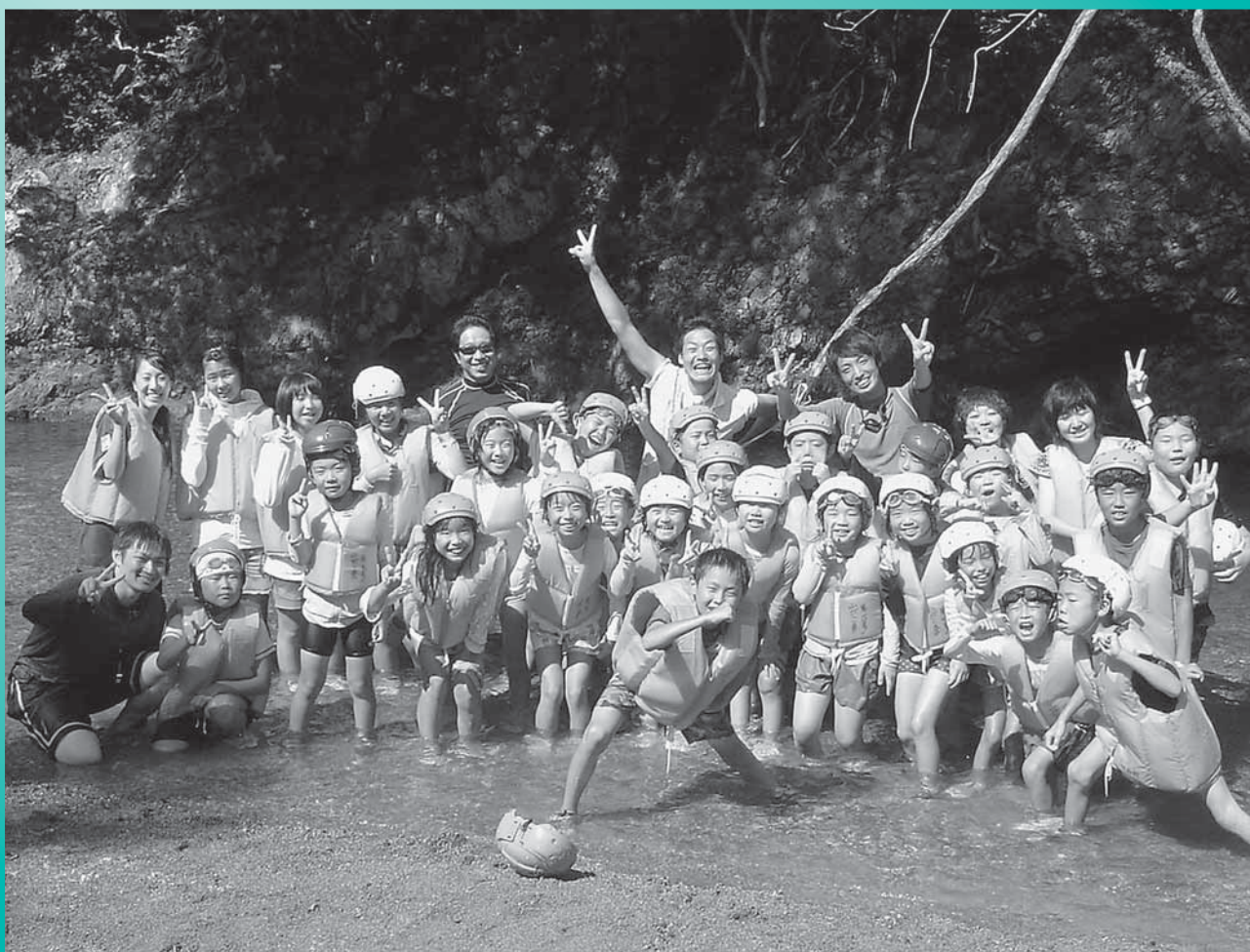
夏休み寺子屋教室

発 行 奈良県吉野郡下北山村役場 Tel(代)07468-6-0001 http://www.vill.shimokitayama.nara.jp/