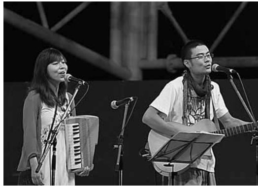
アンニョン・クレヨンのミニライブ