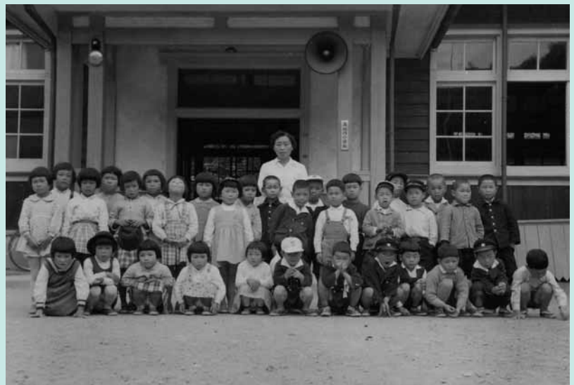
寺垣内小学校昭和38年卒業生 入学当時の写真