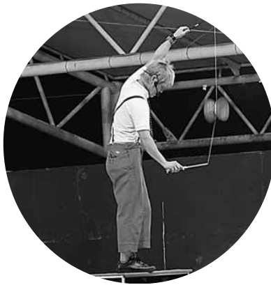
わくわくブーブの大道芸